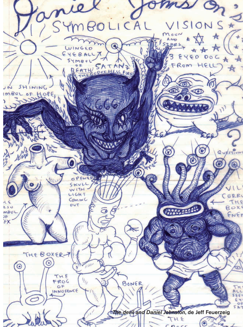
The devil and Daniel Johnston, de Jeff Feuerzeig