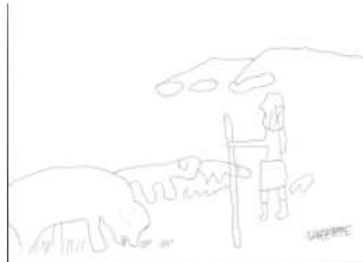
Ilustración por Vicente

Egipto ha salido de su estado de dependencia con respecto a las grandes potencias y actualmente tiene mucho turismo por sus construcciones.